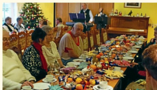
Zufriedene Besucher der Weihnachtsfeier 2018

Mit großen Schritten geht es auf das Jahresende zu. Davor liegt Weihnachten mit seinen Feiern und Festlichkeiten. Das Weihnachtsfest ist für jedermann und gerade den Heiligabend soll jeder in froher Gesellschaft verbringen.